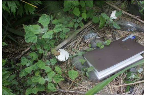
写真8 ウミネコの卵の殻【2回目】