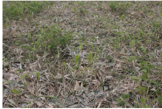
写真10 台地繁殖地（営巣が少ない） 【2回目】