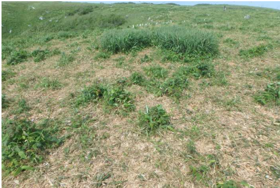
写真11 台地繁殖地の繁殖状況（ほとんど消失）【3回目】