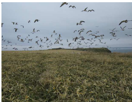
写真6 台地繁殖地【1回目】