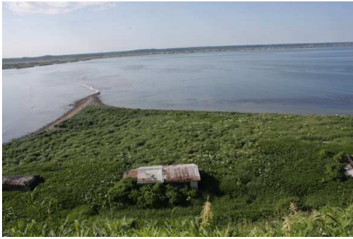
写真9 消失した高密度繁殖地【2回目】