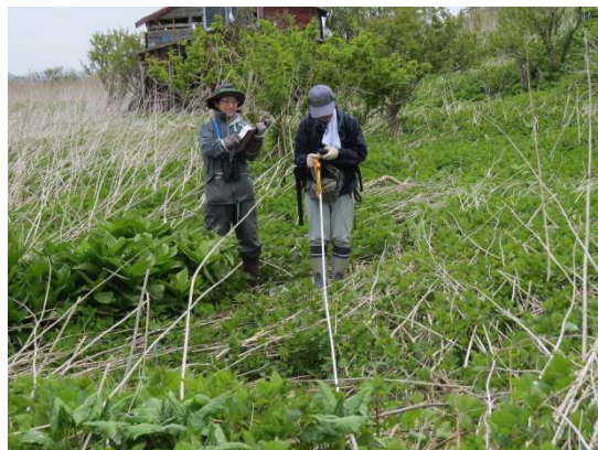
写真2 調査風景【1回目】