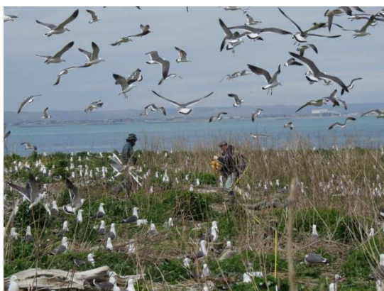
写真3 調査風景【1回目】