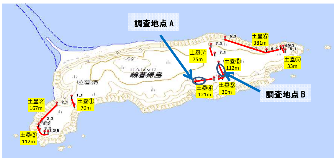
図 3 コシジロウミツバメ巣穴利用率調査地点

また、コシジロウミツバメの巣穴利用率を算出するために巣穴密度の高い土塁区において 50 個の巣穴に直接手を入れて巣穴の利用状況を調べた。場所におけるばらつきを配慮して調査区を図のとおり、2 箇所設置してそれぞれ 50 個の巣穴を調べた。なお、明らかに堀かけの巣は調査対象から除いた。巣穴が複数であるが、内部で一つにつながっていた巣に関しては、複数の巣穴で利用していたと見なした (つまり、巣穴が 3 つではあるが、内部で合流して親及び卵が確認できた場合は、巣穴 3 つで利用があったと見なした)。さらに卵のみ、雛のみ確認された場合も、営巣放棄等の可能性があるため、利用率の算出からは除いた。