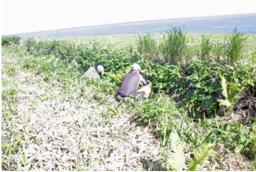
写真7 コシジロウミツバメの 巣穴利用率調査【2回目】