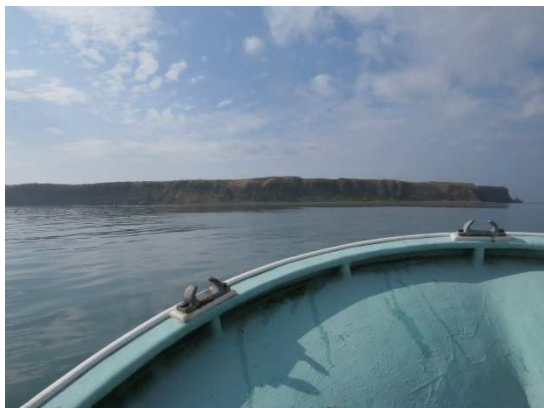
写真1 大黒島全景【1回目】