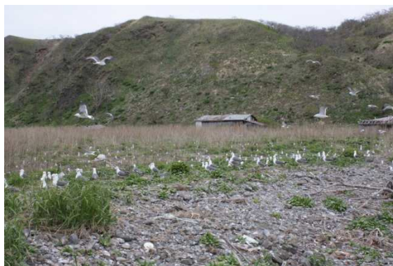
写真4 ウミネコの高密度繁殖地【1回目】