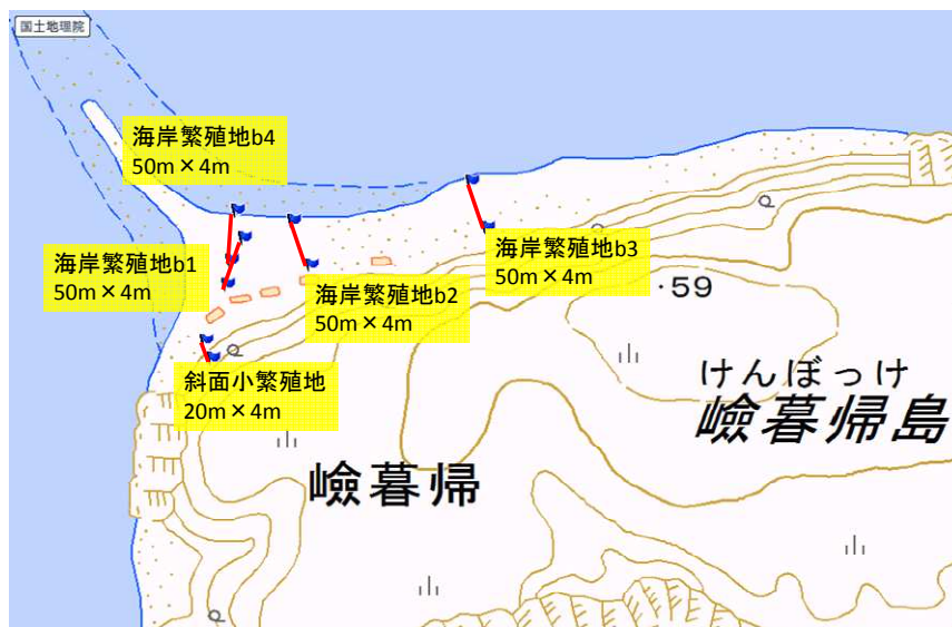
図2 トランセクトの位置図

砂州のある海岸地域に広範囲でウミネコの営巣が確認されたが、巣密度に地域で差があると推察されたため、密度ごとに図2のようなコドラートを設置した。