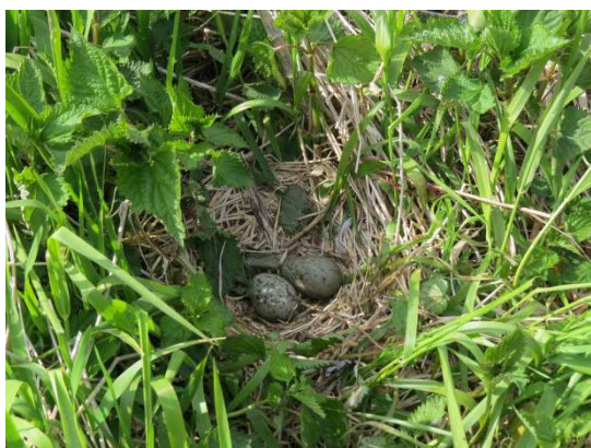
写真5 ウミネコの巣【1回目】